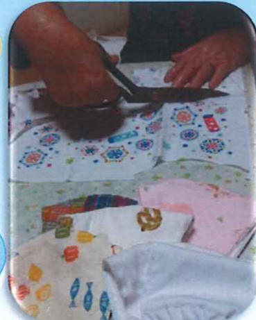
得意な裁縫で マスク作り

畑仕事や手芸の趣味を楽しくやるのは 元気の妙薬だ。面白いからこれからも続けて いきたいな。今日は何を、明日は何をやる かと考えるとわくわくするんだ。